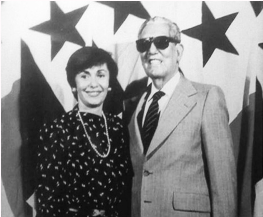
Mireya Moscoso y Arnulfo Arias.