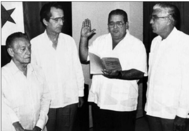
Juramentación en la base militar norteamericana de Clayton.