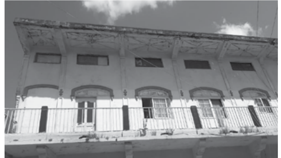
Sala Francesa, casa de dos pisos en Calidonia, Calle N.

Un 10 de septiembre de 1972, domingo en la mañana, varias decenas de obreros de la construcción se reunieron en la Sala Francesa, una casa de dos pisos que todavía existe en Calidonia, Calle N, y allí decidieron fundar el Sindicato Único Nacional de Trabajadores de la Construcción y Similares (SUNTRACS).